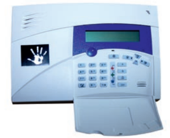
Hybrid-Zentrale zur Funksteuerung